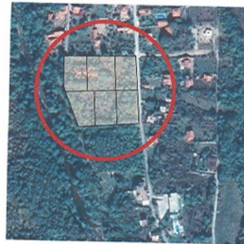
СХЕМА НА МЕСТОПОЛОЖЕНИЕТО НА ИМОТИТЕ М 1:5000

Жм Жилищна устройствена зона с ниска височина височина 2/3(10) 60% плътност на застрояване К интензивност - 1,2 40% минимална плътност на озеленяване свободен начин на застрояване - e