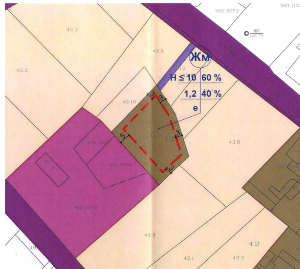
Подробен устройствен план - План за застрояване М 1:1000