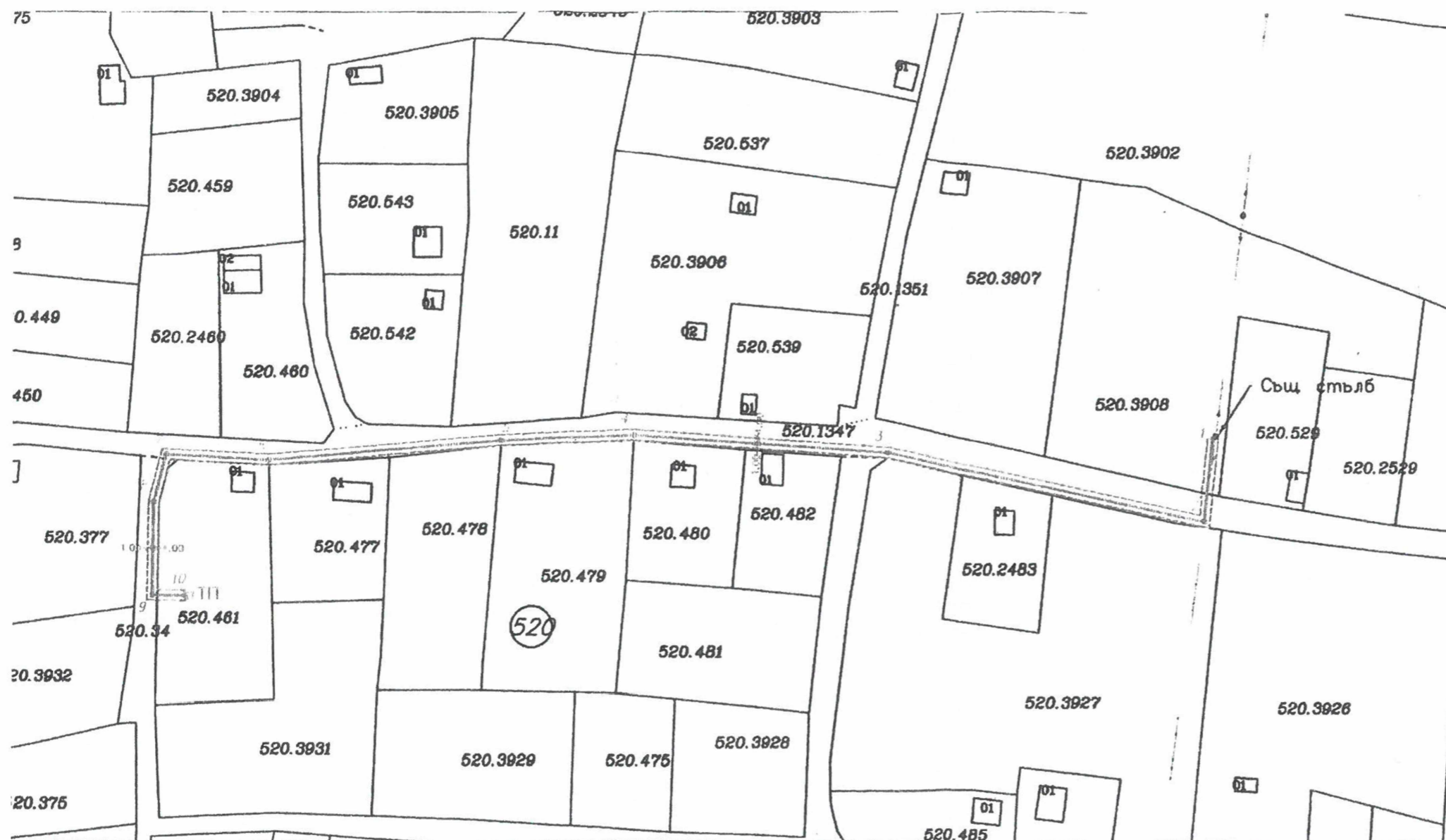
КООРДИНАТЕН РЕГИСТЪР Координати на чупките на сервитута