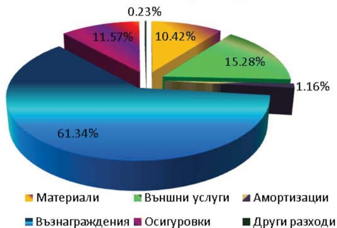
Относителен дял на разходите за 2022 г