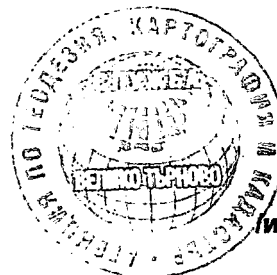
Схема № 15-890515-12.08.2021 г. издадена въз основа на заявление с входящ № 01-442713-10.08.2021 г.