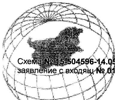
Схема № 15-504596-14.05.2021 г. издадена въз основа на заявление с входящ № 01-255880-13.05.2021 г.

Акт за частна общинска собственост 389 № 103 том 21 рег. 7378 от 14.10.2004г., издаден от Служба по осигуряването на териториите гр.Велико Търново