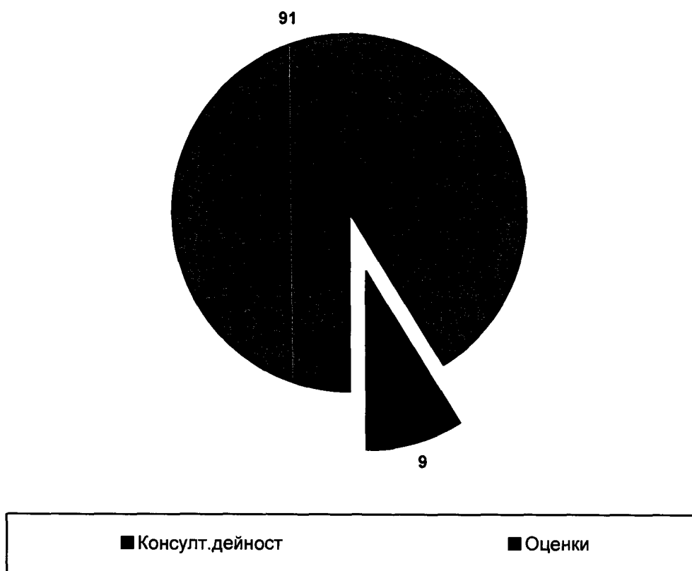
Процентно разпределение на приходите