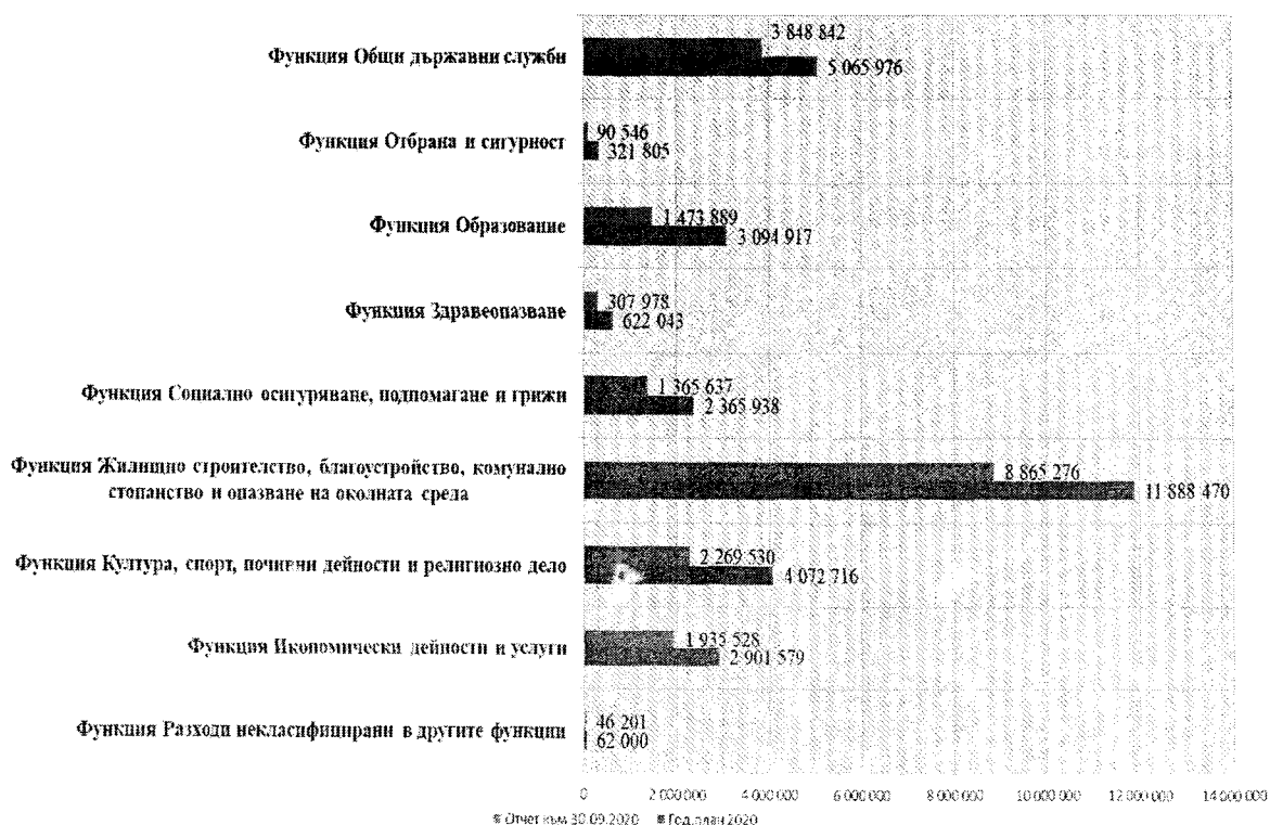
Изпълнение на Бюджета на разходите за Местни и Дофинансирани дейности по Функции /без капиталови/ към 30.09.2020 г.