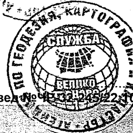
Схема № 15-296055-03.04.2019 г. издадена въз основа на документ с входящ № 01-129353-25.03.2019 г.