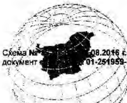
Схема № 15-405886-17.08.2016 г. издадена въз основа на документ № 01-251959-17.08.2016 г.

Схемата да послужи за: Служба по вписванията